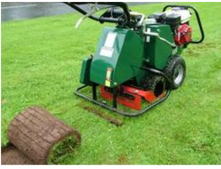
TCDRB Giyotin Makası 4 Tekerden Çekişli