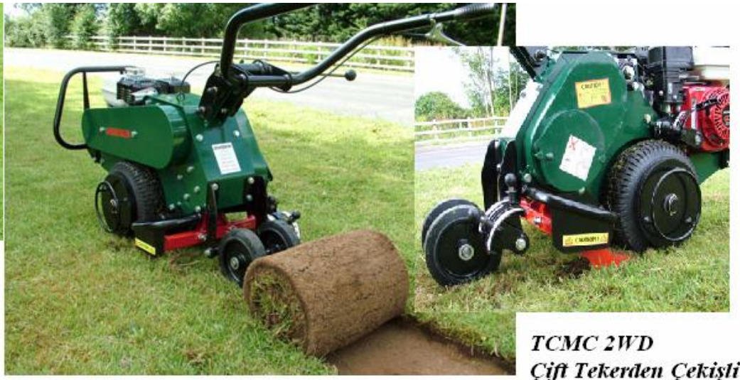
TCMC 2WD Çift Tekerden Çekişli