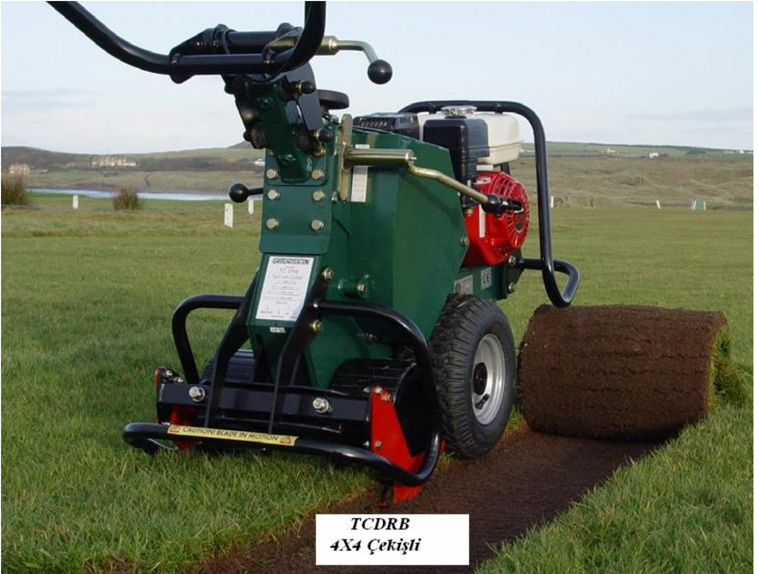
TCDRB 4X4 Çekişli

Profesyonel kullanım için, Profesyonellerin seçimi!